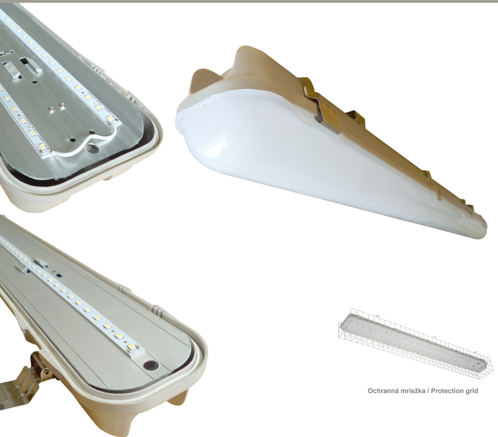
Ochranná mriežka / Protection grid

LED WATERPROOF LIGHTS / LED prachotesné svietidlá